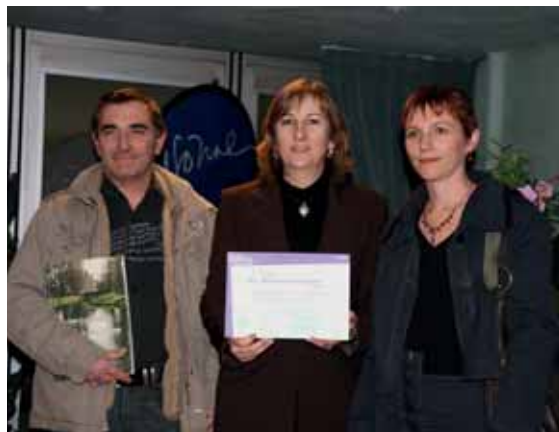
La commune a décroché la 2 e fleur au concours départemental des villes et

En obtenant les 2 fleurs du concours départemental des villes fleuries et en décrochant, pour la 2 e année consécutive, le Trophée Fleur Verte, notre commune conserve son rang.